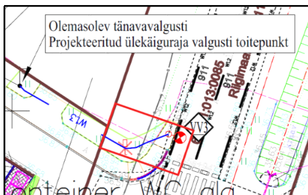
Joonis 1. Väljavõte elektriprojektist

projekteeritud ülekäiguradade valgustite toitekaablid AXPk 4x25, kaablikaitsetorus 750N, Ø75mm.